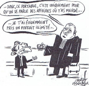
« Le Canard enchaîné » - mercredi 12 mars 2014